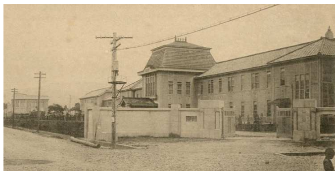
長岡高等工業学校 開校10周年記念絵葉書 (戦後、新潟大学工学部)