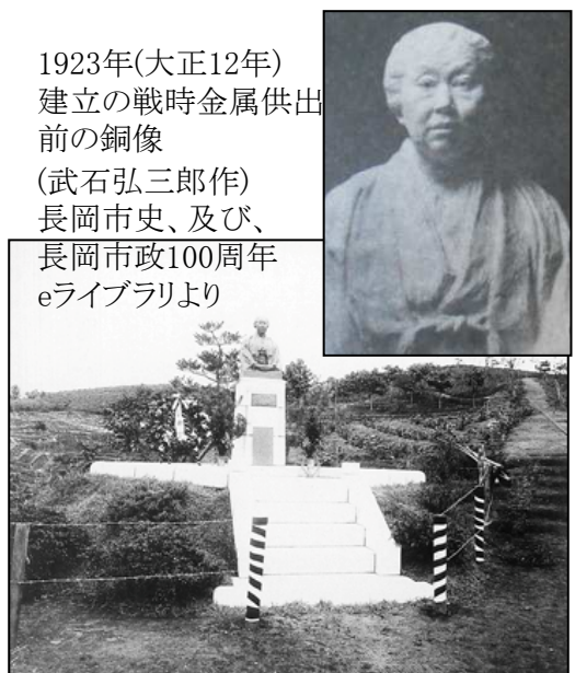
1923年(大正12年) 建立の戦時金属供出 前の銅像 (武石弘三郎作)

(2) の碑文「以成肅雍之徳」は、西園寺公望によるもの。 ~別途、「ガイドからのメッセージ」に、「西園寺公望と大河津分水」に、日本女子大を含め、学校教育支援者としての西園寺公望の一面、そして京都の立命館大学にある西園寺公望像の復元像も説明しています。