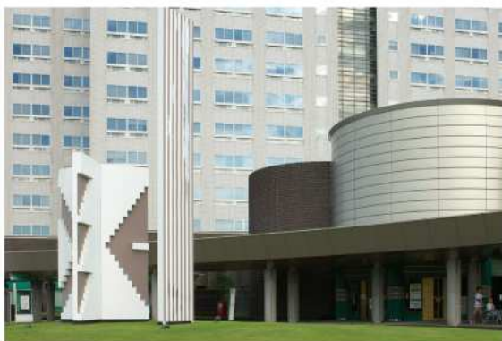
日赤病院と亀倉のモニュメント

一つは、病院だけに当然何かしらの傷を持った人がここを訪れるのだから、傷を持った人にはこんな建造物には関心があるかどうか、という疑問がまず浮かぶのである。二つには、もし仮に何らかの関心があったとして、ここに佇んで向き合う場所を何処に求めればいいのか、という疑問もある。モニュメント