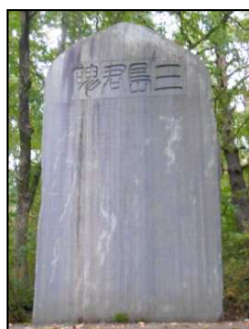
信濃川桜堤の三島像