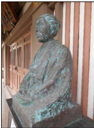
(草生津・唯教寺本堂前)